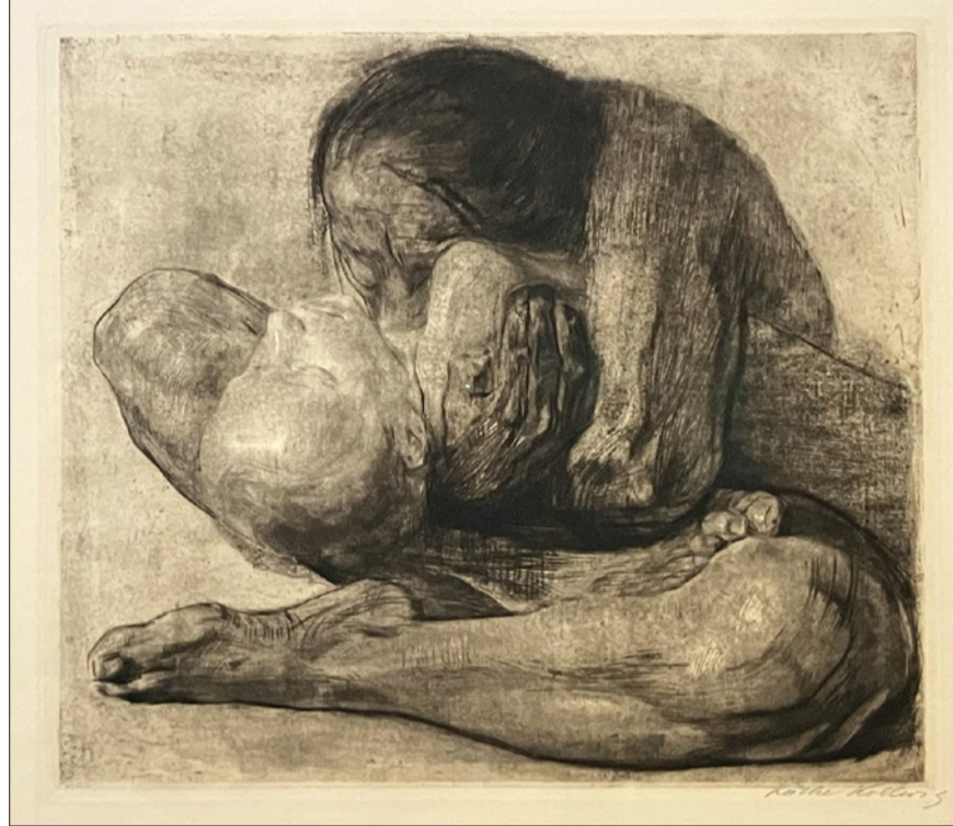
Ölü çocuklu kadın 1903 | Städel Müzesi Sergisinden 2024

Toplumun bir bölümünün resmi hükümet çağrısına refleksimsi, aceleci ve ahlaki-duygusal tepkisi, birincisi “sağa” karşı direnişin barışsız mümkün olmadığını ve ikincisi, faşizmin ve aşırı sağcılığın ne anlama geldiğini ve kimlerden kaynaklandığını bilmek için “sağ” terimine dair kamuoyunda oldukça büyük ve ayrımlandırılmış bir tartışmanın yürütülmesi gerektiğini yansıtmaktan