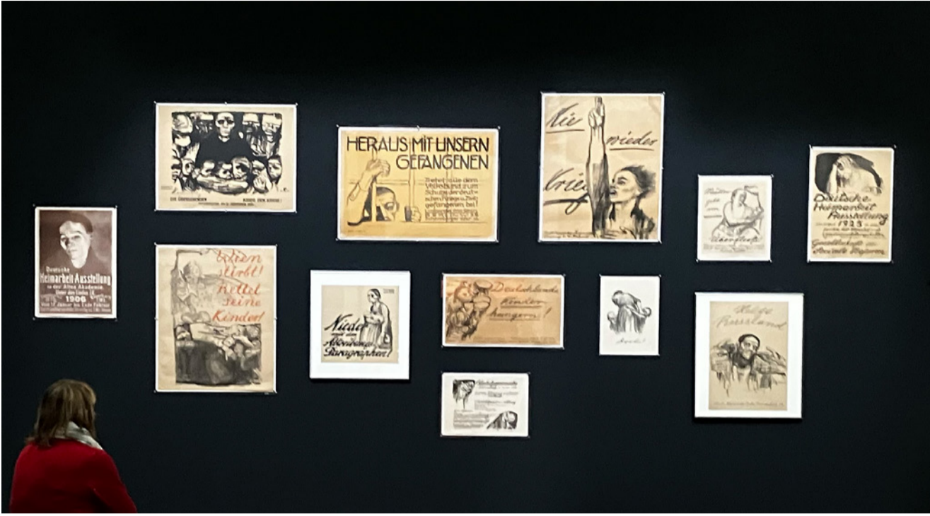
Kollwitz'in Afişleri | Städel Müzesi Sergisinden 2024

onların işledikleri suçlardan sorumlu tutulamazlarsa da, belli ki yandaş ya da failler olarak gerçekten suçlu olabilecek ebeveynlerinin ve büyükanne ve büyükbabalarının suçunu ağır bir yük olarak taşıdıkları açıktır. Tahminen 6 milyon insanın ölümüyle sonuçlanan akıl almaz bir cürümü pişmanlık takip etmek zorunda. Her borç ödenmek ister. Ve böylece binlerce kişi, o zamanlar yaşananların bir daha asla yaşanmaması gerektiğini itiraf etmek için yola çıktı.