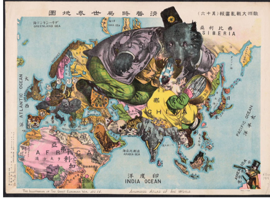
The illustration of the Great European War. No. 16

Ukrayna hükümeti bu anlaşmayı uygulamaya istekli değildi. Sağcı, milliyetçi güçler tarafından engellendiğine dair birçok ipucu var. Federal bir anayasa iç ve dış barışı tesis edebilirdi. Ukrayna hükümeti ise bunun yerine NATO'ya girmek için diretti. Bu da Rusya'da NATO tarafından eksiksiz bir kuşatma altına alınma korkusu yarattı. Koşulları yanlış değerlendiren Rusya Devlet Başkanı Putin'in emrini verdiği, uluslararası hukuku ihlal eden saldırı savaşı salt büyük acılara neden olmuyor, ayrıca dünya toplumu ve gezegen için öngörülemez sonuçlar doğuruyor. Gezegenin kurtuluşu şimdilik ertelenmiştir.