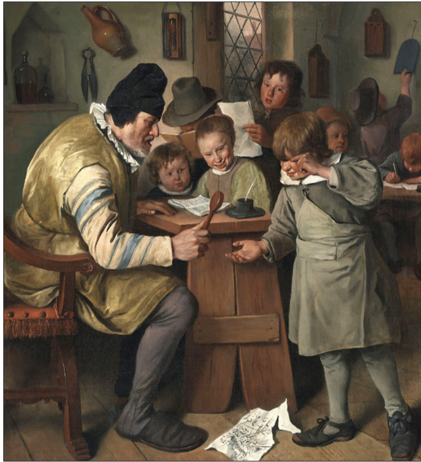
Jan Steen - The Village School (National Gallery of Ireland)

ve anlayışlıların sergileyeceği kabalık gündemdedir. Saflar belirlenmiştir.