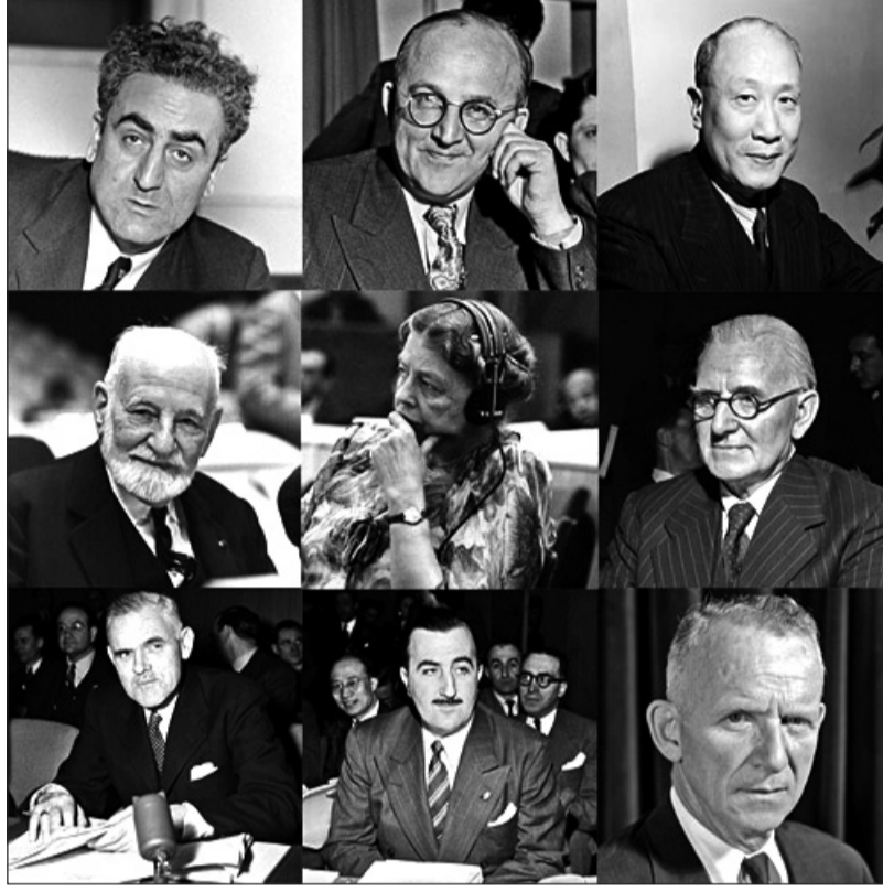
PoliTeknik EĞİTİM HAKLARININ GENİŞLETİLMESİ PROJESİ 5. YILINDA

Buradaki umulmadık çelişki, bu küreselleşmeye (sermaye ve çıkarlarının) iletişimin, paylaşımın ve ilgili konuların tartışılmasının bölgesel ve hatta yerel sınırlandırılışına tekabül etmesinde yatıyor. Örneğin büyük şirketlerin ya da küresel paydaşların (Stakeholders) ezici iletişimsel üstünlüğüne denk düşecek yaygın bir karşı kamuoyu mevcut değil: Aslında dijital medya böylesi bir kolektif fikir alışverişinde bulunmak için fevkalade olanaklar sunuyor. Ancak ticari öncüllerle yönetilen dikkat ekonomisinde dahi insanları salt üretici değil, her şeyden önce veri tedarikçisi olarak sömürmenin gündemde olduğu belirginleşiyor. Bu insanları, adeta düşünüş, duyumsama ve eylemliliklerini, bir bakıma dijital kapitalizm için hammadde tedarik edecek, üretici olacak ve akabinde gayriresmi ürettiklerini tüketen şekilde kendilerini kanalizasyon eden tüketiciler olarak kullanmak gündemdedir, ki bununla tetiklenen dolanımın kendisi bir bakıma kâr olarak toplanıyor. Ekonomik, ama ayrıca politik kararlardan etkilenenlerin diyalogu fiilen engellenmiştir. Eğitim konuları bağlamında da olduğu gibi. Aslında hâlâ ilgili