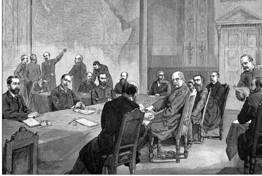
Kaynak: Wikimedi Commons, Kongokonferenz

Aşırı sağcılık otoriter ve kadın düşmanı düşünüşün ve de Nasyonal Sosyalizmin hafif gösterilmesinin yanı sıra, ırkçı ve milliyetçi inançların ana öğelerini içinde taşır. Genelde ırkçılık özgül bir tanımla yapılmadan demokratik toplumların büyük bir bölümü tarafından reddediliyor. Ama ulusal devletlerin kendisi ve ulusal olarak tanımlanmış, bu devlet içerisinde "kendinden olan" nüfusun diğer uluslar karşısında ayrıcalıklı kılınması ve de dayandığı nüfus içerisinde "buna ait olmayan" olarak tanımlanan kişileri dezavantajlı konuma getirmesi eleştirinin odağına pek yerleşmiyor. Siyasal ve sendikal cenahtan "biz işçilerimizin işyerlerini oldukları yerde koruyoruz" ya da "önce Almanlar" şeklinde uyguladıkları yatırıma elverişli rekabet bölgesi milliyetçiliği, genelde ne dünya toplumunun adaletiyle ilgili ne de ırk-ulusçu (völkisch) ve milliyetçi ve ırkçı ideolojiler ve toplumsal gruplarla örtüşmesiyle ilgili sorulara açık değildir. Bu nedenle devamında şu soru yöneltilmelidir: Savunulabilir, adalet yönelimli bir milliyetçilik ve ulusdevletüstü bir milliyetçilik var mıdır? İdeal tipik olarak şu milliyetçilikler 1 arasında ayırım yapılabilir. Gerçekte bu milliyetçilikler mücadelesi verilen tartışmalarda birbiriyle örgüldür ve daima aksi tartışmalar da mevcuttur.