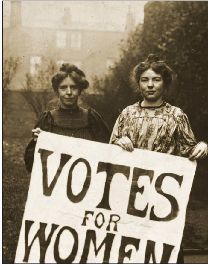
Annie Kenney and Christabel Pankhurst

Ama internetten bağımsız olarak da kimlik politikasına dahil edilen birçok ihtilaf politik içerikli değil. Yazının başında değinilen örneğe dönelim! Mekâna giriş yasağı muhtemelen "burada" kimin sözünün geçerli olduğunu göstermek ihtiyacından doğmuştur yalnızca, ancak siyahilerin rasta saçlarla neyi anlatmaya çalıştıkları hakkında düşünmeye yöneltmez bu ya da bir beyazın bu saç modelini taklidinin kuşkulu bir tasviri mi olduğunu, yoksa olumlu anlamda özdeşleşmeyi mi ifade ettiğini tartışmaya pek de yol açmaz. Hatta bir Müslüman öğrencinin şu çıkışı politik bir eylem değildir. Bu genç kadın öğretmenlerin türban takmasına kuşkuyla yaklaştığını ifade eden bir öğretim görevlisi hakkında haklı kışkırttığı gerekçesiyle suç duyurusunda bulunuyor 7 . Öğrenci böylece türban takma konusunu hukukçulara havale ediyor. Başarı şansını bir kenara bırakalım. O, açtığı dava ile artık kendi grubu için hak talep etmiyor, aksine davalının cezaya çarptırılmasını ve dolayısıyla bir düşüncenin dile getirilmesinin yasaklanmasını amaçlıyor. Öğretim görevlisinin eğitim görüşüne tepki vermek üzere öğrencinin sahip olduğu alternatifler arasından (dersin ardından görüşmek, yazışmalarda tartışmak) ancak doğrudan diğer dinleyicilerin önünde protestoya başvurmak siyasal nitelik taşırdı. Böyle bir durumda tutum sergilemek kolay değil. Ama ancak bu şekilde, küçük de olsa bir dinleyici kesimi üzerinde etkili yaratabilirdi. Belki de bir tartışma ortamı yaratabilirdi. Sonradan duyulan dava