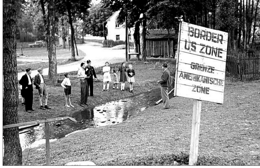
Kaynak - Wikicommons Media: Bundesarchiv Bild 183-N0415-363, Mödlareuth, Zonengrenze.jpg; Bundesarchiv, Bild 183-N0415-363 / Otto Donath / CC-BY-SA 3.0

Aslında 1955'te Almanya Anlaşması ile işgal yasalarının büyük bir bölümü kaldırıldı ve 1990'da, bir barış