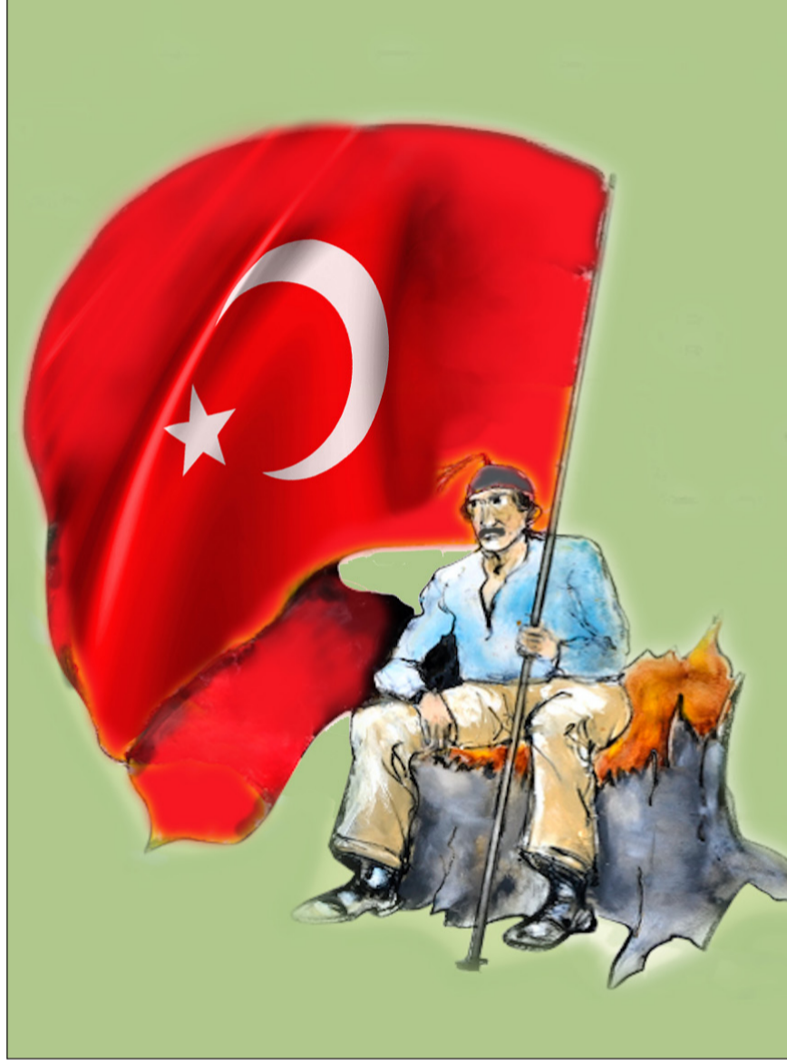
Deutscher Michel bir Alman otosteryoptir.

Türkiye kökenlilerin kurdukları örgütlerin çok kez birleştirici değil ayrıştırıcı konuları/hususları öne çıkarmaları nedeni ile Almanya politikasını etkileyici tek bir güç/eylemsellik ortaya çıkamamaktadır. Bu genel sorun Türkiye'deki gelişmeler sürecinde daha da ayrıştırıcı konuma dönüşmüştür. Yurt dışında ikamet eden Türkiye Cumhuriyeti vatandaşlarının Türkiye'deki cumhurbaşkanlığı ve TBMM seçimlerinde oy kullanabilmeleri, bu bağlamda